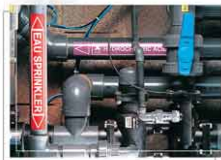
Csővezetékek helyszíni azonosító jelölése!