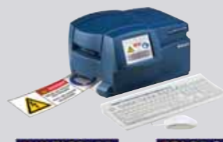
MULTICOLOR ÉRINTŐKÉPERNYŐS, SZÍNES, ÖNÁLLÓ KÉSZÜLÉK