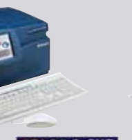
COLOR & CUT ÉRINTŐKÉPERNYŐS, SZÍNES ÉS KIVÁGÓ