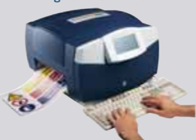
TÖBBSZÍNŰ ÉS NAGYMÉRETŰ