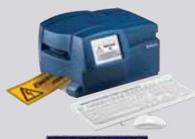
MONOCOLOR ÉRINTŐKÉPERNYŐS, MONOKRÓM, ÖNÁLLÓ KÉSZÜLÉK