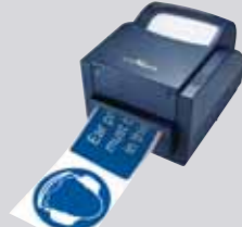
KOMPAKT MONOKRÓM PERIFÉRIÁLIS EGYSÉG