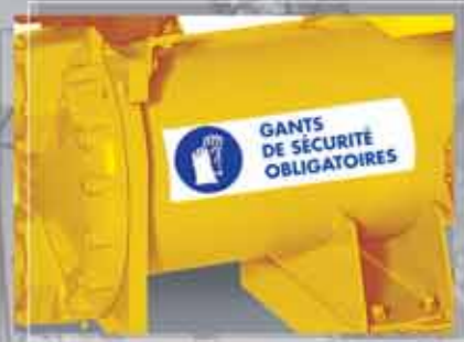
Kerülje el a baleseteket a megfelelő azonosító címkék használatával!

A MiniMark™ Megoldás jelenti a felhasználó-barát tulajdonságok és a kreatív versenyképes költségű ideális kombinációját.