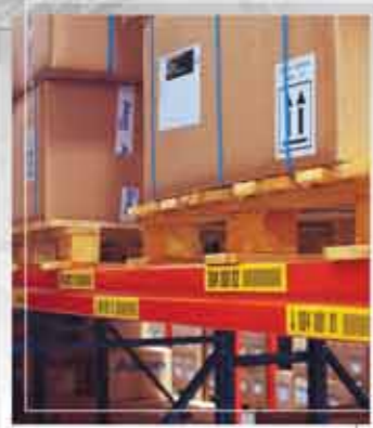
Gondoskodjon raktárkészletének hatékony címkézéséről!