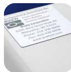
Vállalati azonosító címkék